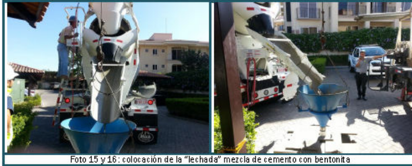
Foto 15 y 16: colocación de la "lechada" mezcla de cemento con bentonita

El sábado 5 se procedió a finiquitar el cierre del pozo, llenando el resto del encamisado con una mezcla de cemento y bentonita (lechada). Esta mezcla consistía en 1100 kg de cemento con 5 sacos de 50 libras de bentonita en polvo, en 1100 litros de agua por metro cubico. (Fotos 15 y 16)