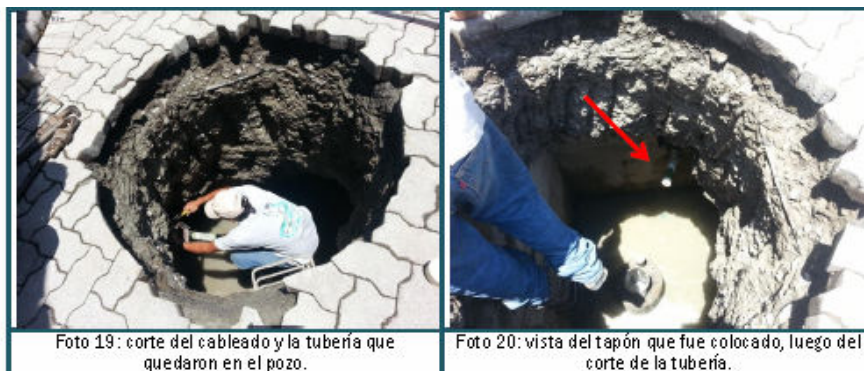
Foto 19: corte del cableado y la tubería que quedaron en el pozo.