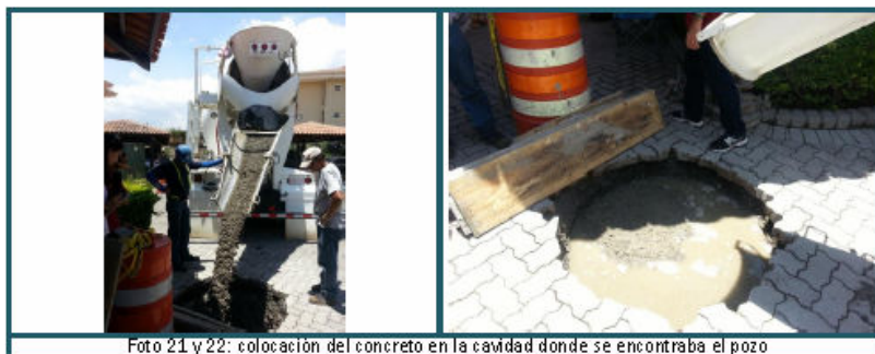
Foto 21 y 22: colocación del concreto en la cavidad donde se encontraba el pozo

Para terminar con el cierre se procedió a llenar la cavidad donde se encontraba el pozo con 6 metros cúbicos de concreto; luego se procedió tapar con tablas para protección y darle el tiempo de secado al concreto, para lo que sería el día lunes 7 la Municipalidad de Belén procedería a colocar los adoquines y dejar listo el lugar. (Foto 21, 22 y 23)