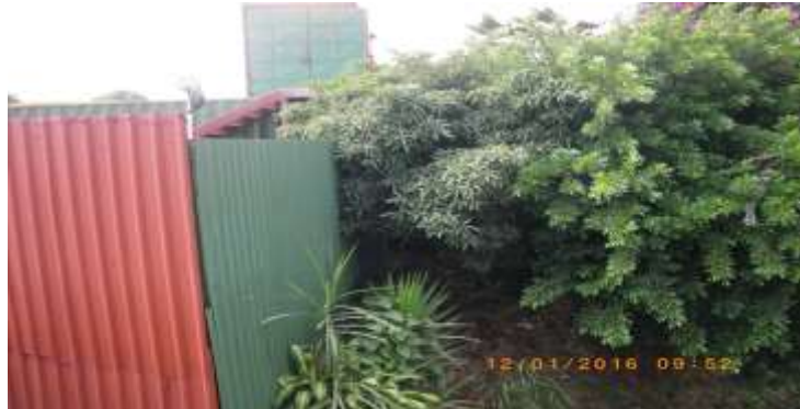
(Colindancia con el Río Quebrada Seca)