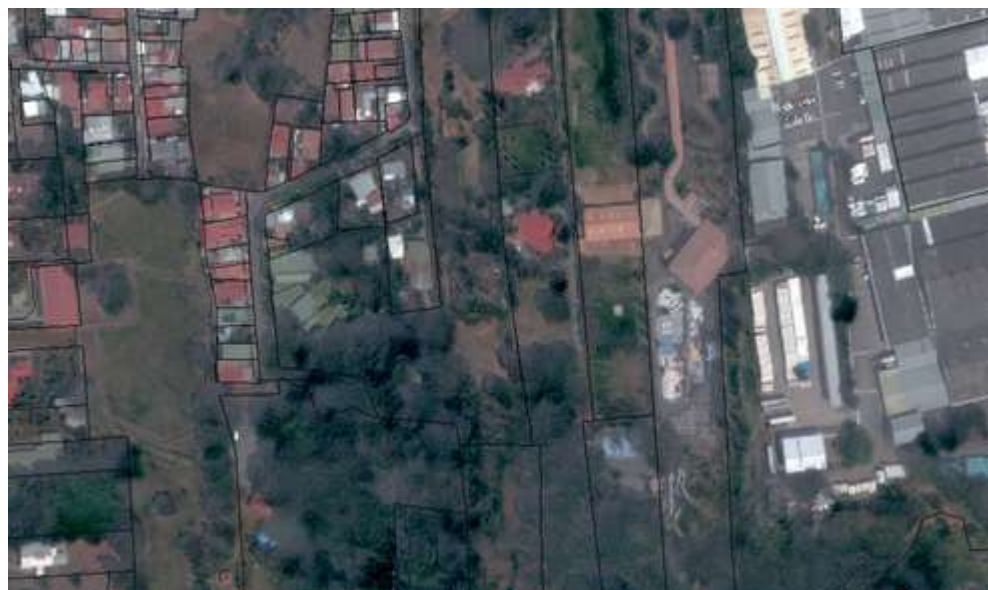
Figura No.4 Longitud del tubo de flujo de la Naciente La Gruta 2015