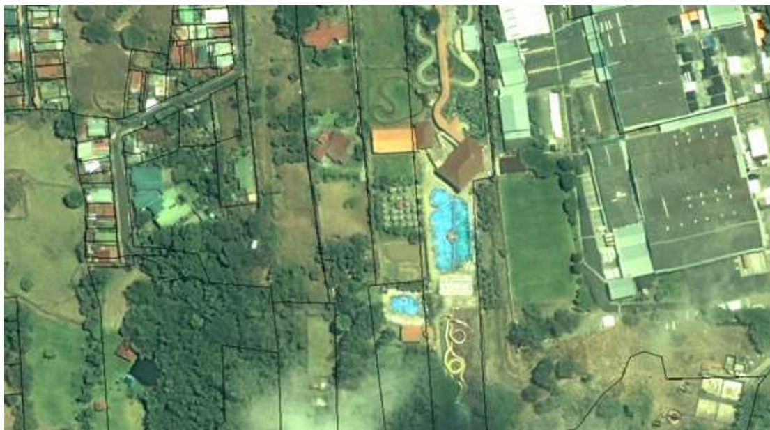
Figura No.3 Imagen satelital del sector la Naciente La Gruta 2015