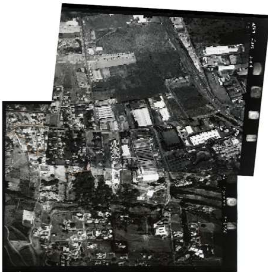
Figura No.2 Ortofoto del sector la Naciente La Gruta 2006