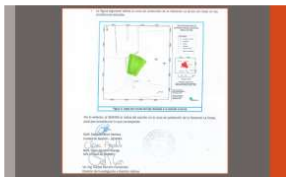
GRÁFICO COMPARATIVO CAMBIO DE ZONA DE CAPTURA Y ZONA DE PROTECCIÓN EN ZONIFICACIÓN (P.R.) NACIENTE LA GRUTA

Naciente La Gruta: Afloramiento del acuífero Barva conformado por lavas fracturadas y brechosas. Este acuífero (Barva) se presenta en la zona de Belén entre 10 y 20 metros de profundidad y cubierto por tobas de la Formación Carbonal.