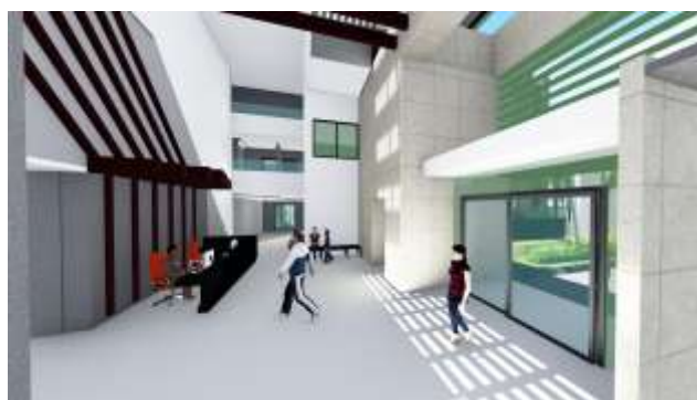
VISTAS INTERNAS DE NIVEL 1