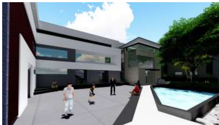
EQUIPO DE TRABAJO (comisión municipal)