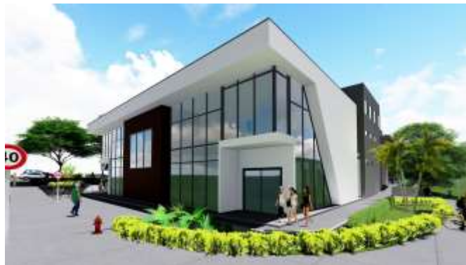
PLANTA ARQUITECTÓNICA DE NIVEL 02