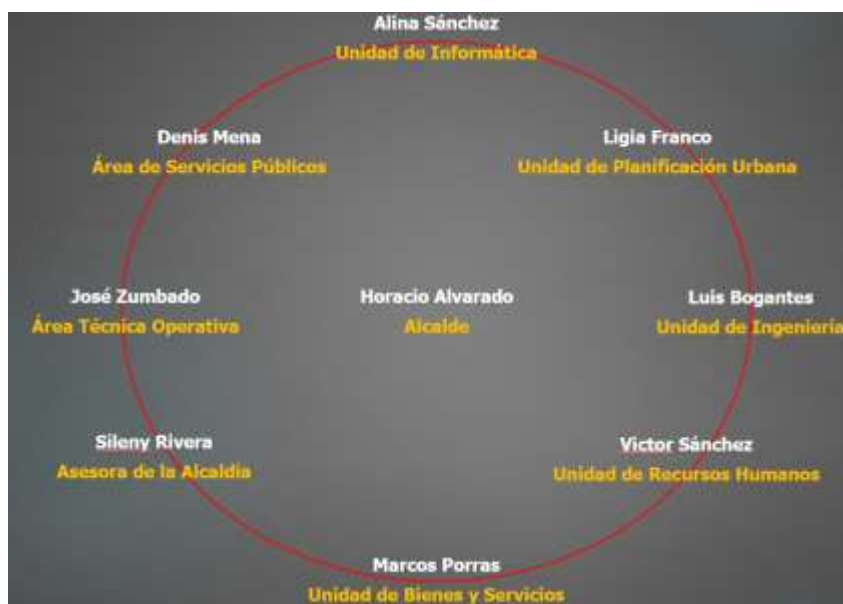
EQUIPO DE TRABAJO (grupo de diseño)