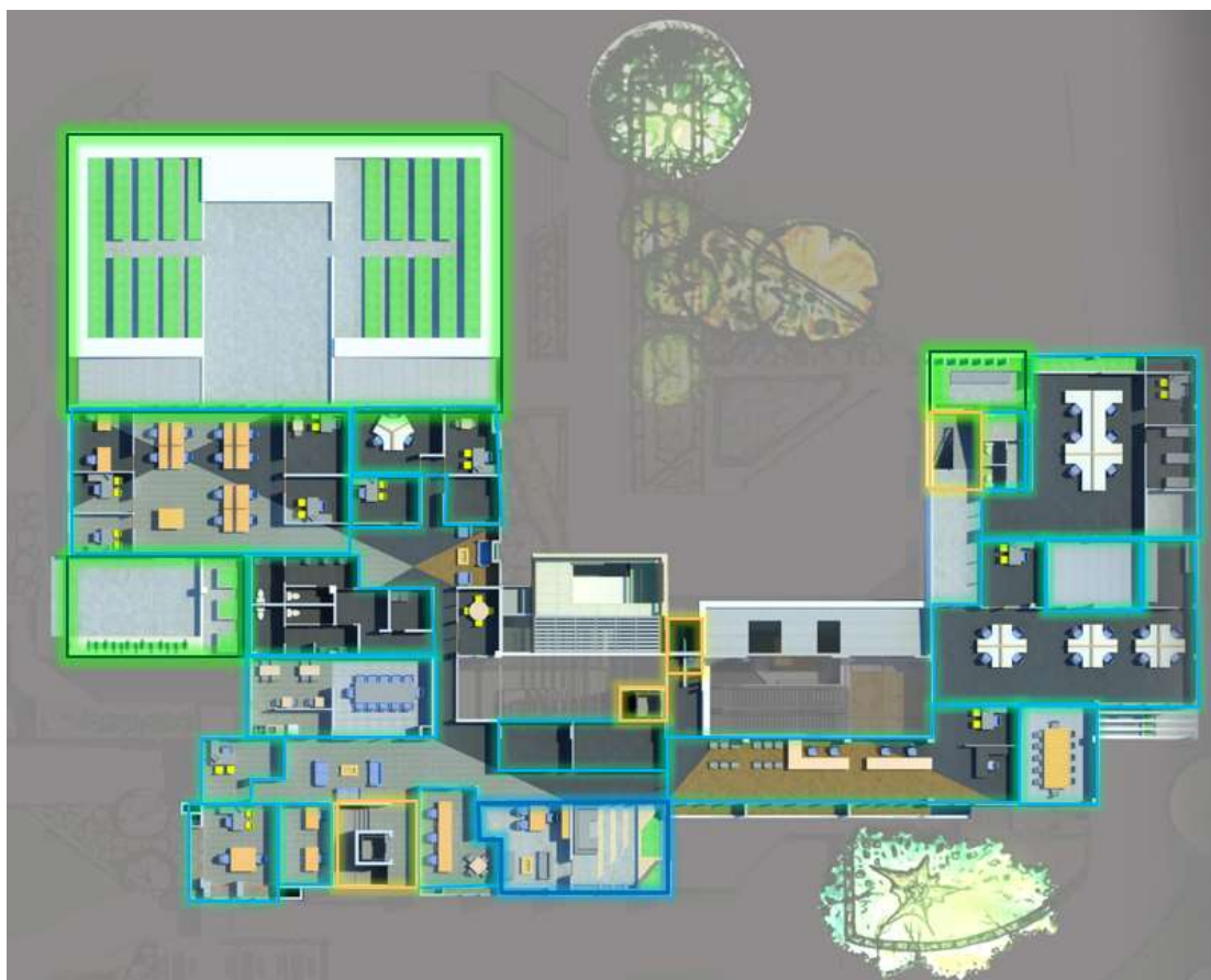
VISTAS INTERNAS DE NIVEL 3