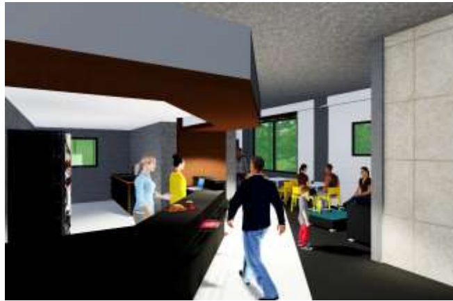
INSTITUCIONES ALIADAS (FACHADA NOR-OESTE)