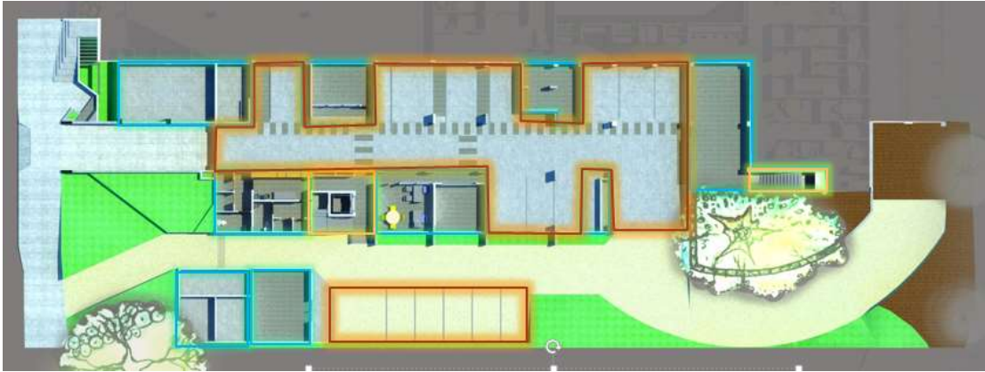
PLANTA DEL COMPLEJO MUNICIPAL