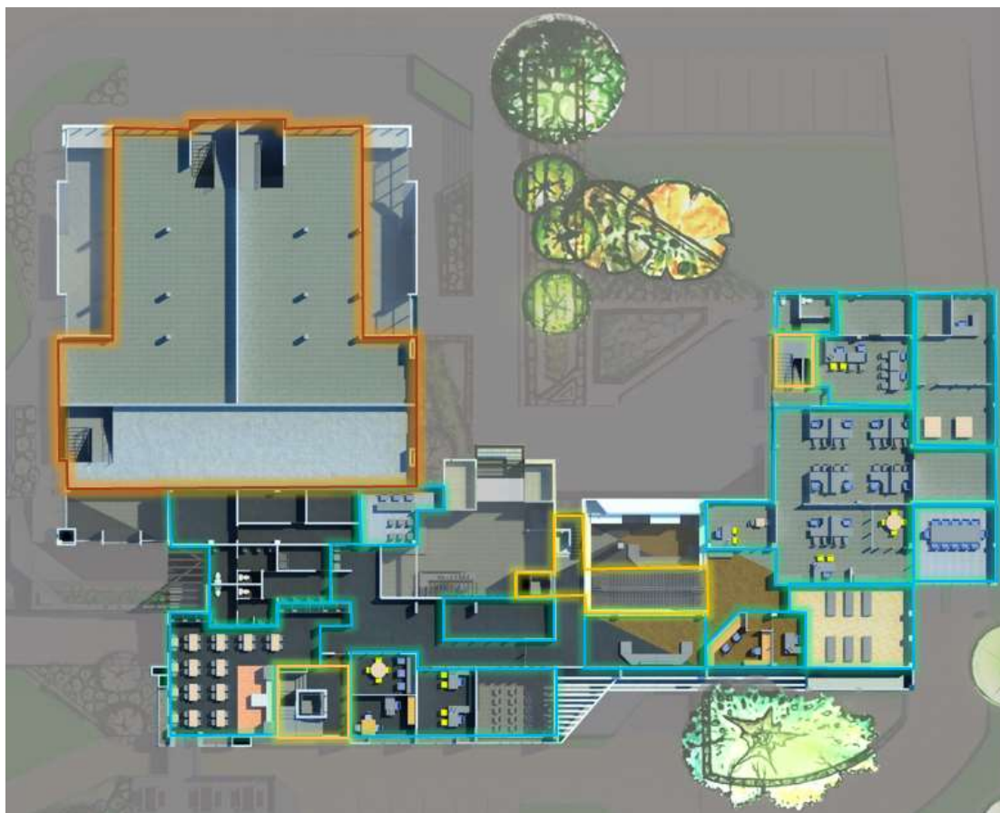
VISTAS INTERNAS DE NIVEL 2