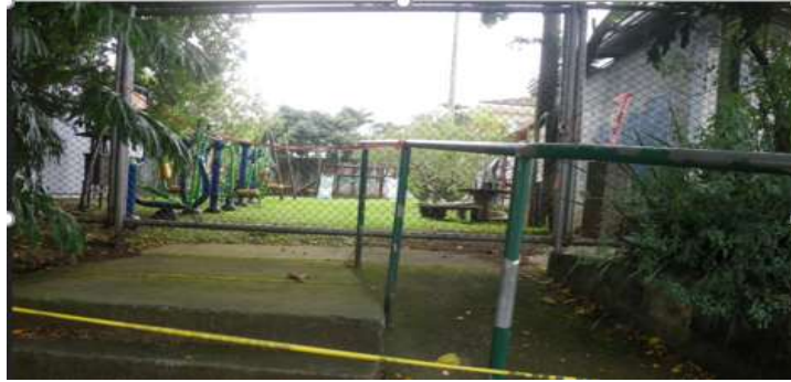
Parque y Juegos Infantiles

Esta propuesta corresponde a una opción oportuna, eficiente y eficaz, que además cumple con parámetros indispensables en cuanto a los siguientes aspectos: